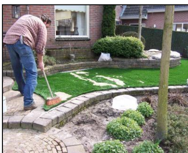
10. Kunstgras na borstelen