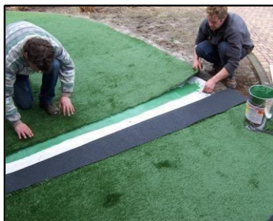
7. Verlijmen van de naden