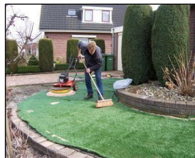
8. Kunstgras borstelen