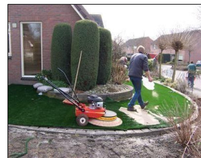
9. Kunstgras instrooien