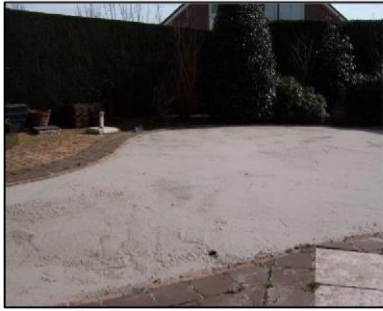
1. Zandbed aanbrengen