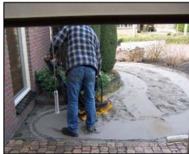
2. Aantrillen zandbed