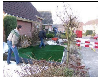
6. Kunstgras waar nodig snijden