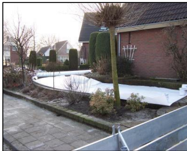
4. Geovlies opmaat