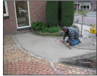
3. Zandbed uitvlakken